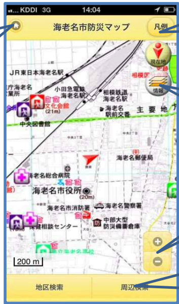
海老名市防災マップ画面