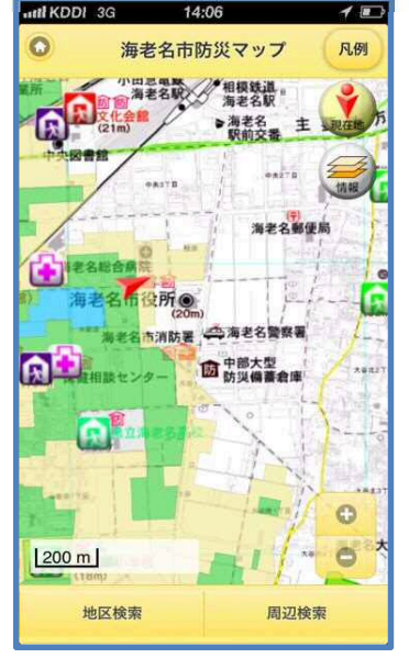
相模川浸水想定区域表示

周辺検索をタップして、「避難所予定施設」、「その他避難所予定施設」、「災害時医療救護関連施設」と距離数を選択します。検索結果アイコンが現れますので、そのアイコンをタップすると検索結果画面が表示されます。